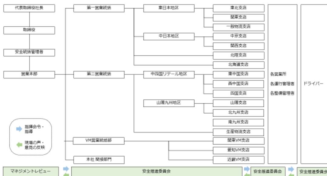
安全に関する組織体制